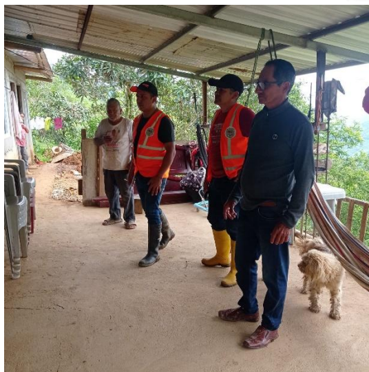
Imagen 10: Levantamiento de información de afectados durante la temporada invernal con el apoyo de Gestión de riesgos.