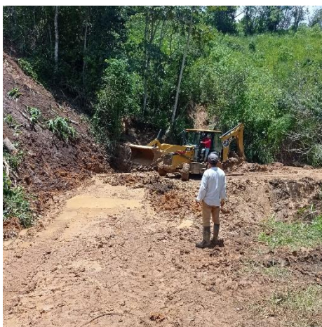
Imagen 2: Mantenimiento vial en los diferentes barrios de la parroquia