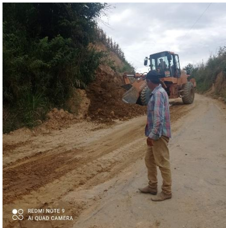
Imagen 1: Limpieza vial y mantenimiento de cunetas, alcantarillas en la vía Buenavista-Panamericana