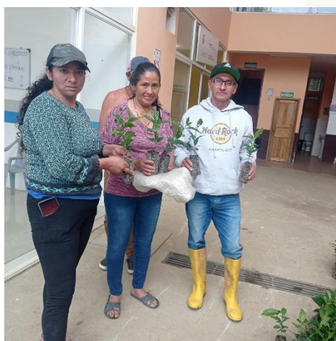
Imagen 6: Entrega de plántulas de café a cafetaleros de la parroquia y sus barrios