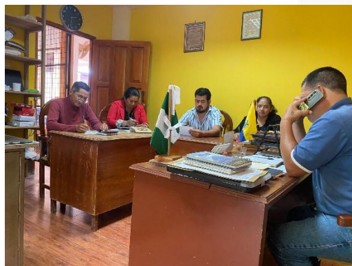
Imagen 3: Participación en sesiones ordinarias convocadas por el señor Presidente