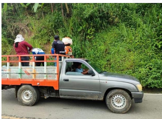
Imagen 15: Fumigación de la vía Buenavista-Panamericana