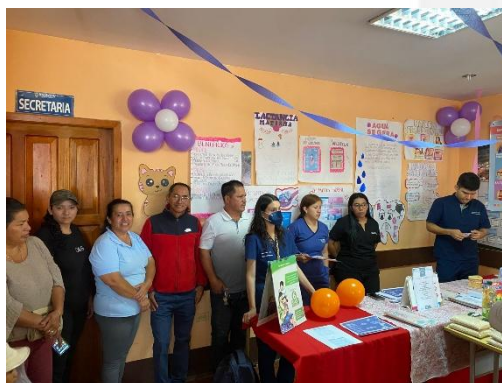
Imagen 12: Participación en ferias de la salud por parte del Puesto de Salud Buenavista