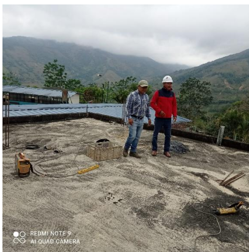
Imagen 14: Verificación del avance del proyecto de mejoramiento del aula de la sala de computo de la Unidad Educativa Edison de la parroquia Buenavista.