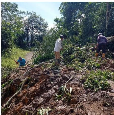
Imagen 4: Desbroce de costado de vías durante la emergencia invernal