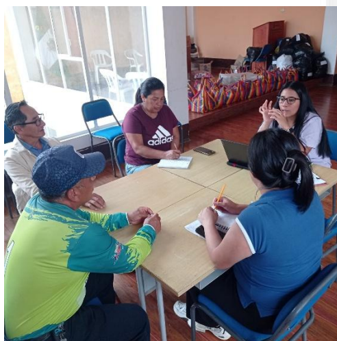
Imagen 9: Participación en reuniones de trabajo de la Mesa Intersectorial Parroquial del Puesto de Salud