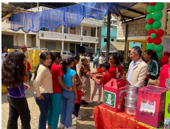
Imagen 7: Limpieza de derrumbes en la vía principal por presencia de lluvias