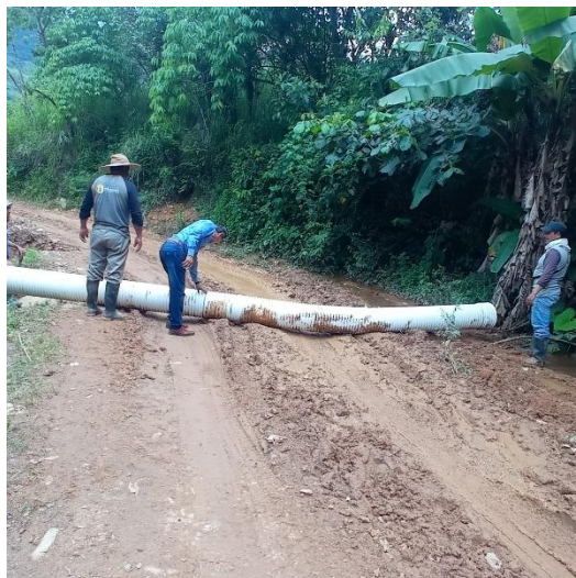
Imagen 8: Colocación de tubería de alcantarilla en diferentes barrios de la parroquia