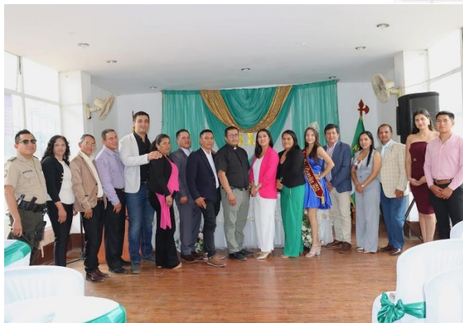
Imagen 13: Participación de los diferentes eventos programados por aniversario de vida política de Buenavista