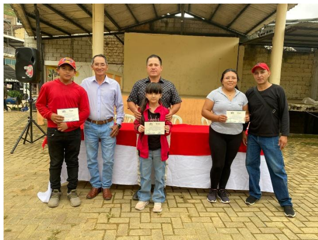
Imagen 15: Participación en clausura del curso de pintura dirigido a niños, jóvenes de la parroquia Buenavista gracias al apoyo de la Prefectura de Loja.