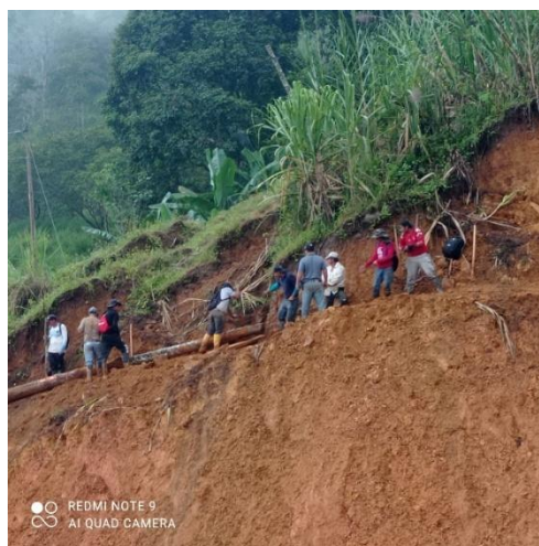
Imagen 5: Participación en mingas de limpieza en diferentes barrios durante la emergencia invernal