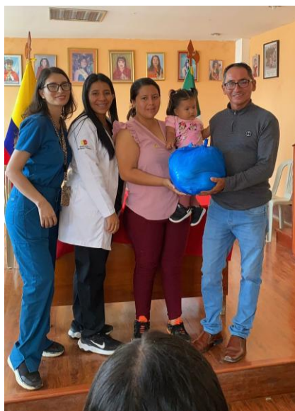
Imagen 16: Entrega de Kits Alimenticios del proyecto Ecuador Crece Sin Desnutrición bajo la dirección del personal del Puesto de Salud Buenavista.

Es todo cuanto puedo informar para los fines pertinentes.